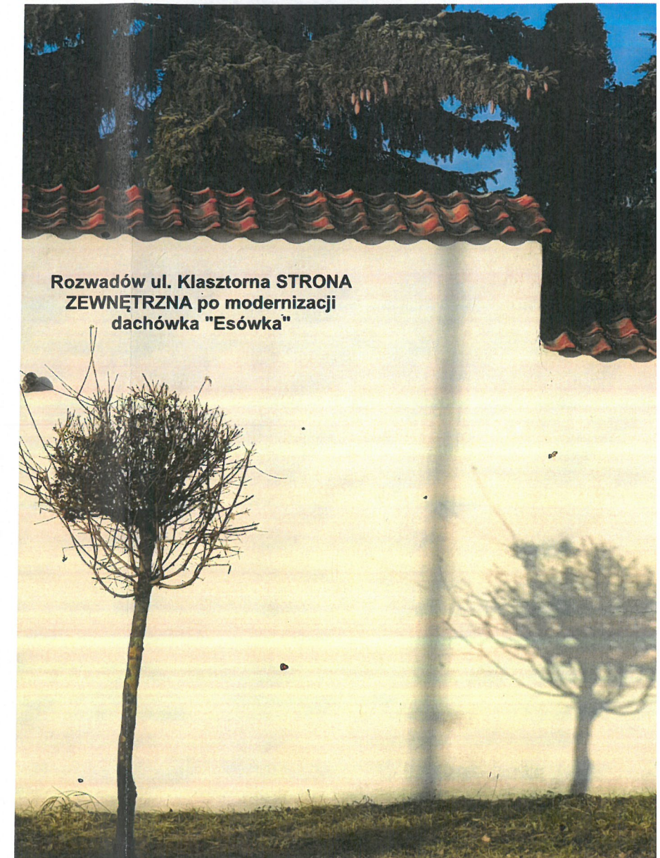
Rozwadow ul. Klasztorna STRONA ZEWNĘTRZNA po modernizacji dachówka "Esówka"